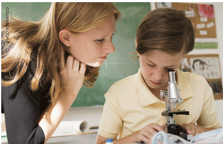
Idealet om den autentiske lærer skaber et billede af, at hvem som helst kan træde ind fra gaden og undervise, hvis de blot har den rette personlighed.

Müller Kristensen. Her griber lærerne til de reaktionsmønstre, som føles fornuftige og naturlige for dem, og de reaktionsmønstre vil i udgangspunktet afspejle deres personlighed.