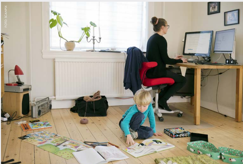
Under coronakrisen skred grænserne mellem det private og det professionelle - særligt for de forældre, der skulle jonglere med hjemmeskole, børnepasning og arbejde på én gang.

niseringer så foldet ud? Hvis vi kigger på uddannelsesorganisationer, er et nærliggende svar digitalisering. Mange omfavnede da også kaldet på digital innovation prompte – selv om arbejdet hermed lå hos den enkelte – understøttet af diverse tech-anbefalinger. Vi har set forskellige digitale hjemmeskoler, onlineundervisning samt kollaborative tech-løsninger poppe op, og vi har selv deltaget i digitaliserede møder, undervisning og sparring fra vores stuer eller kontorer (hvis man er så heldig) med risiko for andre beboere, fx små børn, som ubudne mødedeltagere. I dette nye mellemrum er de kendte organisationer af tid og rum, der sædvanligvis adskiller private og professionelle praksisser, forsvundet, og sociale kategorier og identitetsmarkører som socioøkonomisk klasse, kulturel eller religiøs baggrund og materielle ressourcer sat til skue. Ledere, undervisere og studerende, børn og forældre gik forrest i den (u)organiserede nòdinnovation af det danske uddannelsessystem. Ikke uden bekymringer eller kritik – men med det efterspurte samfundssind.