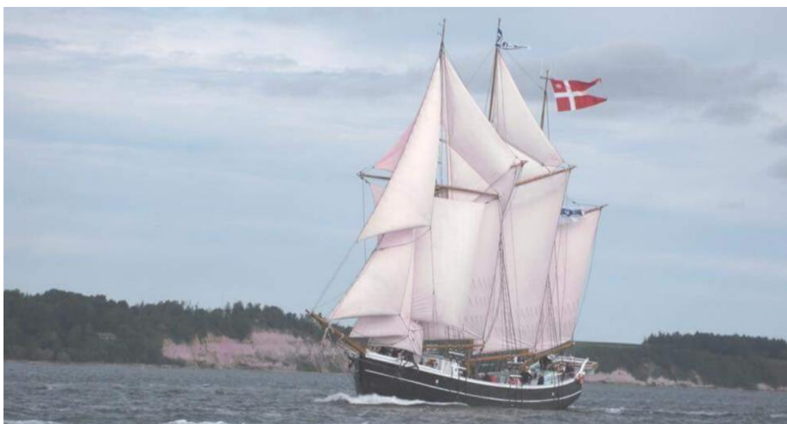
Figur 2. Skonnerten Fulton © Jakob Jensen

Denne rapport omhandler udelukkende om Fultons aktuelle virke som nyt pædagogisk tilbud målrettet udsatte unge under ledelse af chefskipper, Jakob Jensen.