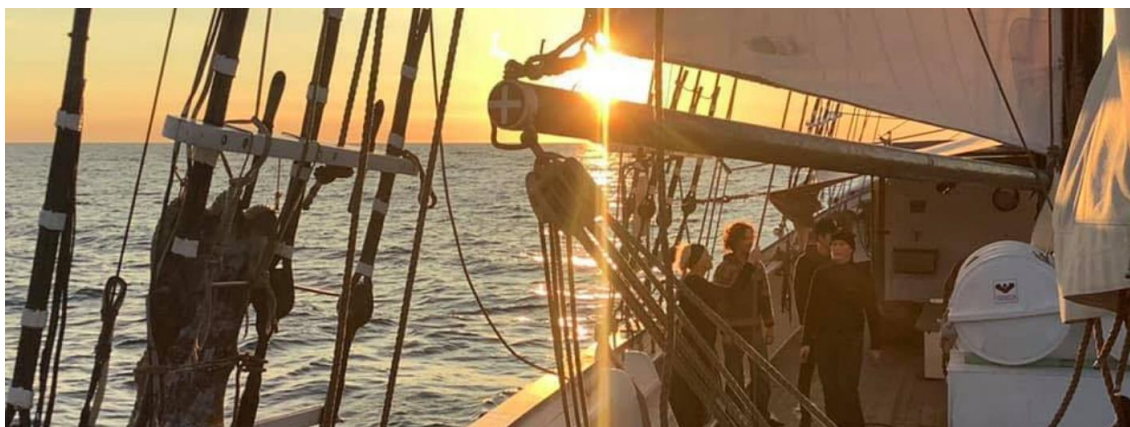
Figur 5. Aftenstemning på Fulton

Inden den unge takker ja til et ophold på Fulton, mødes han/hun med Skipper Jakob. Jakob går altid en kort tur med den kommende matros for at "tænde et lille lys i den unge" (Jensen, 2021). Derefter kan den unge så vælge at takke ja eller nej til et ophold på Fulton. Hvis den unge takker ja, følger der derefter en prøveuge ombord på skonnerten. På den måde kan den unge få en fornemmelse af, hvad livet til søs indebærer og derefter på et kvalificeret grundlag vælge, om de ønsker at fortsætte opholdet (Jensen, 2021). I kapitel 6 i rapporten redegør vi nærmere for Esbjerg Kommunes kriterier og visitationsproces.