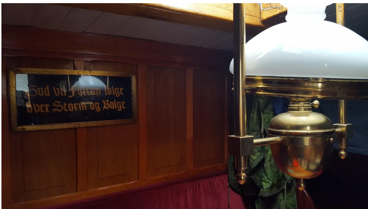
Figur 24. "Gud vil Fulton følge over storm og bølge". © Jakob Jensen