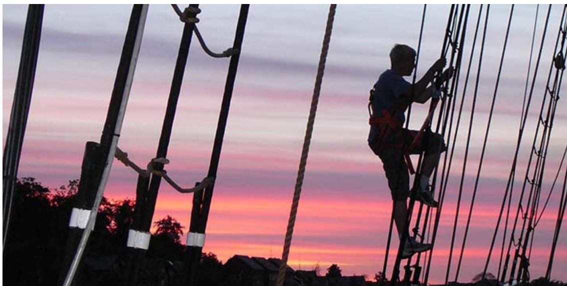
Figur 20. På vej mod masten © Fulton

der videre på resultaterne, kan det siges, at det at blive set og hørt og være en del af et større fællesskab er et afgørende forhold, når der opsummeres på de unges udtalelser. Sammenfatningerne i figur 17 og 18 beror på tværgående opsamlinger af de unges udsagn og kan derfor siges at tegne et overordnet billede af de forhold, der er betydningsfulde for de unge og Fulton-projektet.