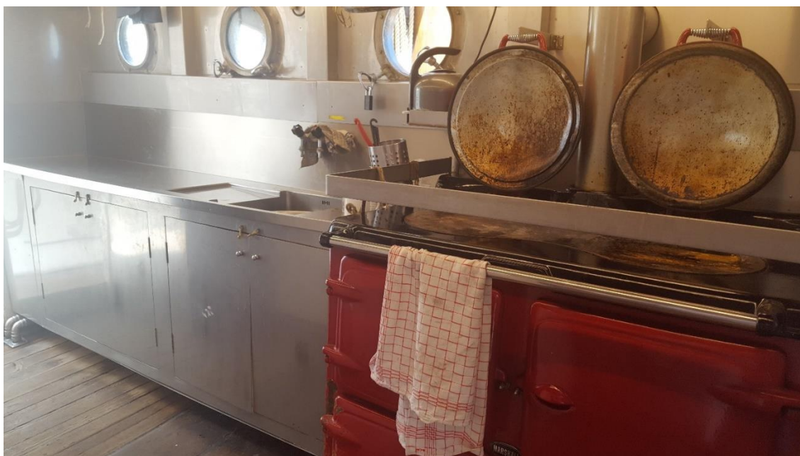
Figur 29. Kabyssen på Fulton.