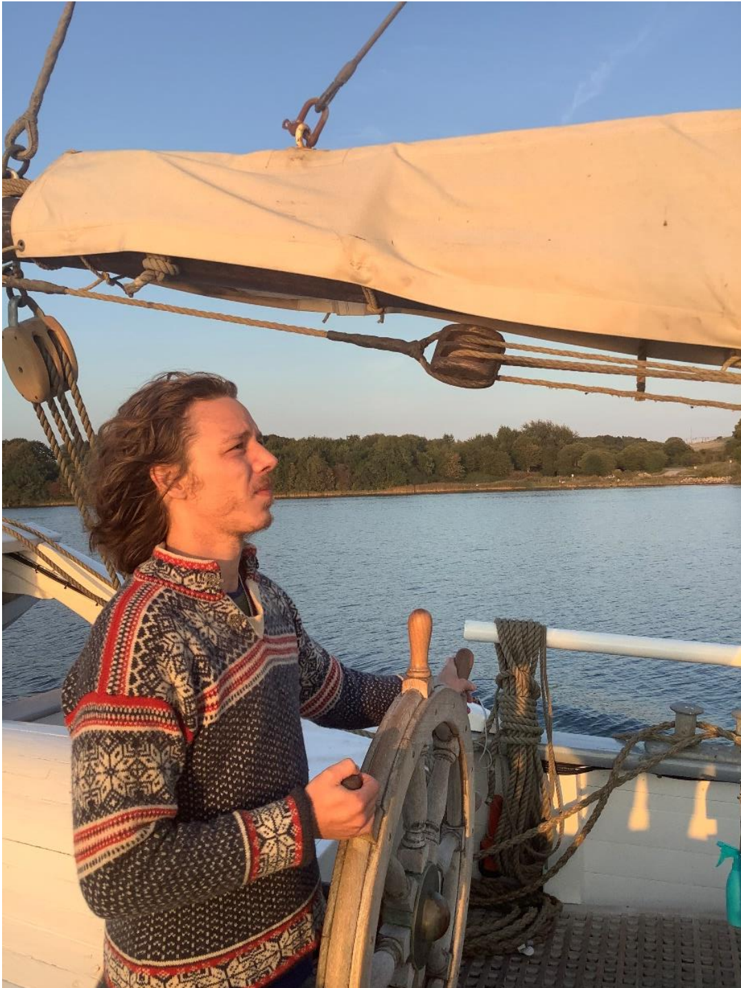
Figur 26. Esbjerg matros tager styringen