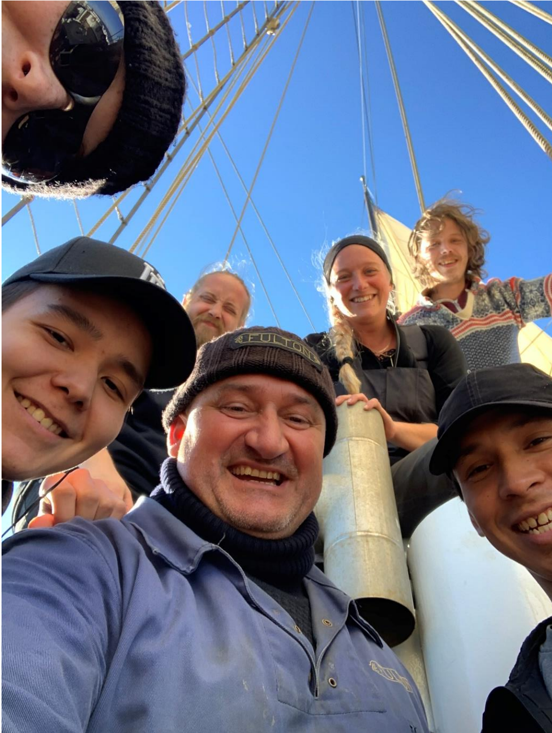
Figur 31. Esbjerg-matros og besætning ©. Fulton