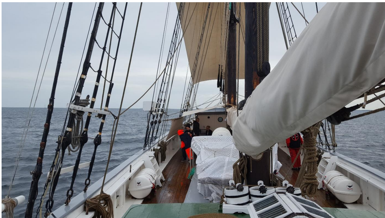
Figur 16. Fulton i rått vejr i Kattegat.

konklusion om hvad denne del af undersøgelsen har vist, og hvad projektet har givet af viden om, hvordan man kan undersøge effekt af en lignende intervention af denne art på lignende mindre projekter, hvor egentlige RCT-studier ikke er mulige.