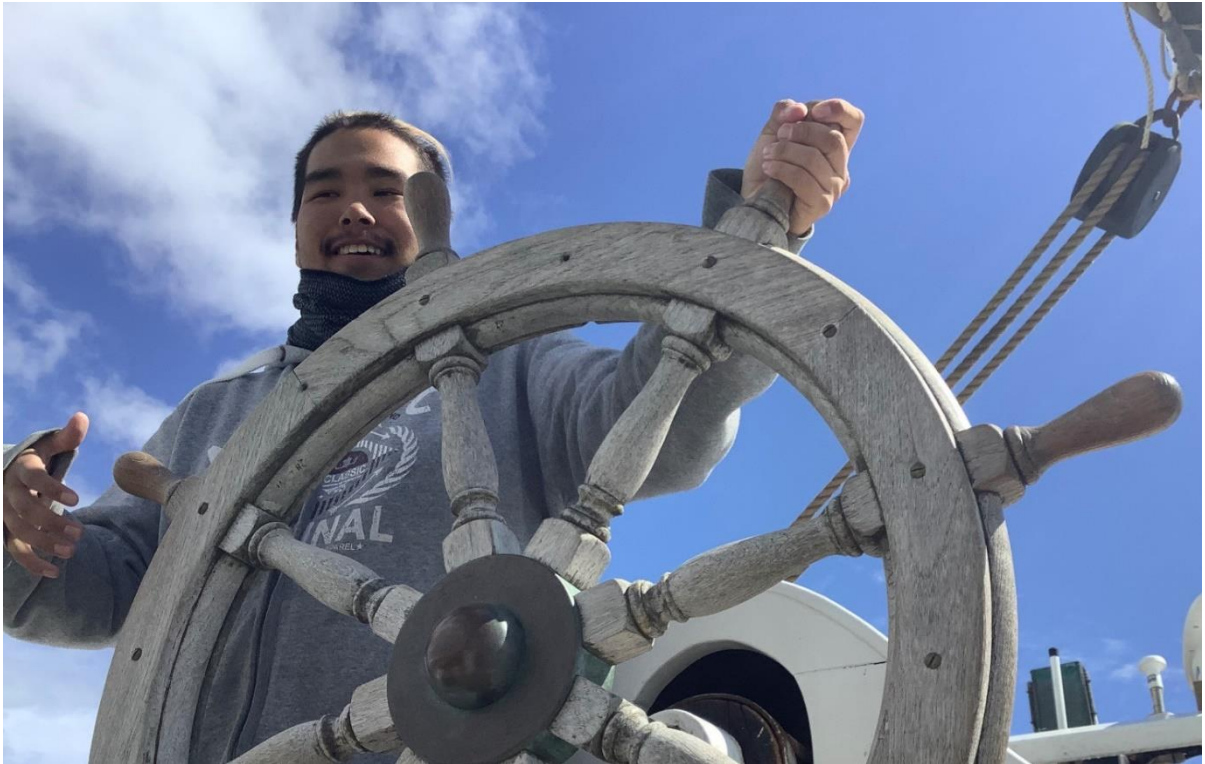
Figur 13. Esbjergmatros styrer.