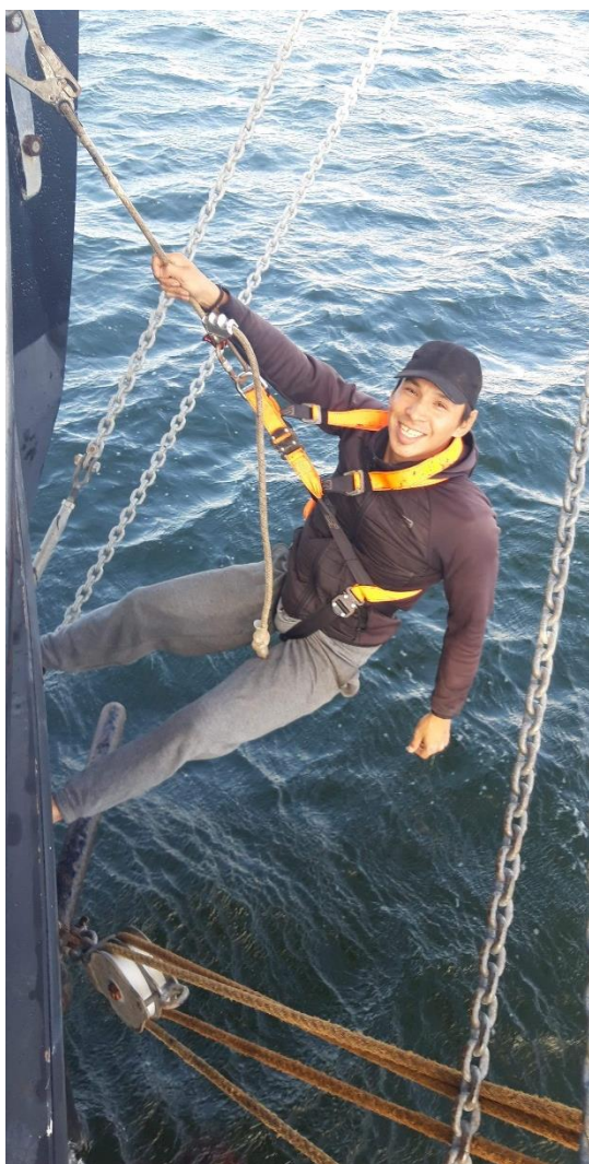
Figur 28. Esbjerg-matros ved anker.