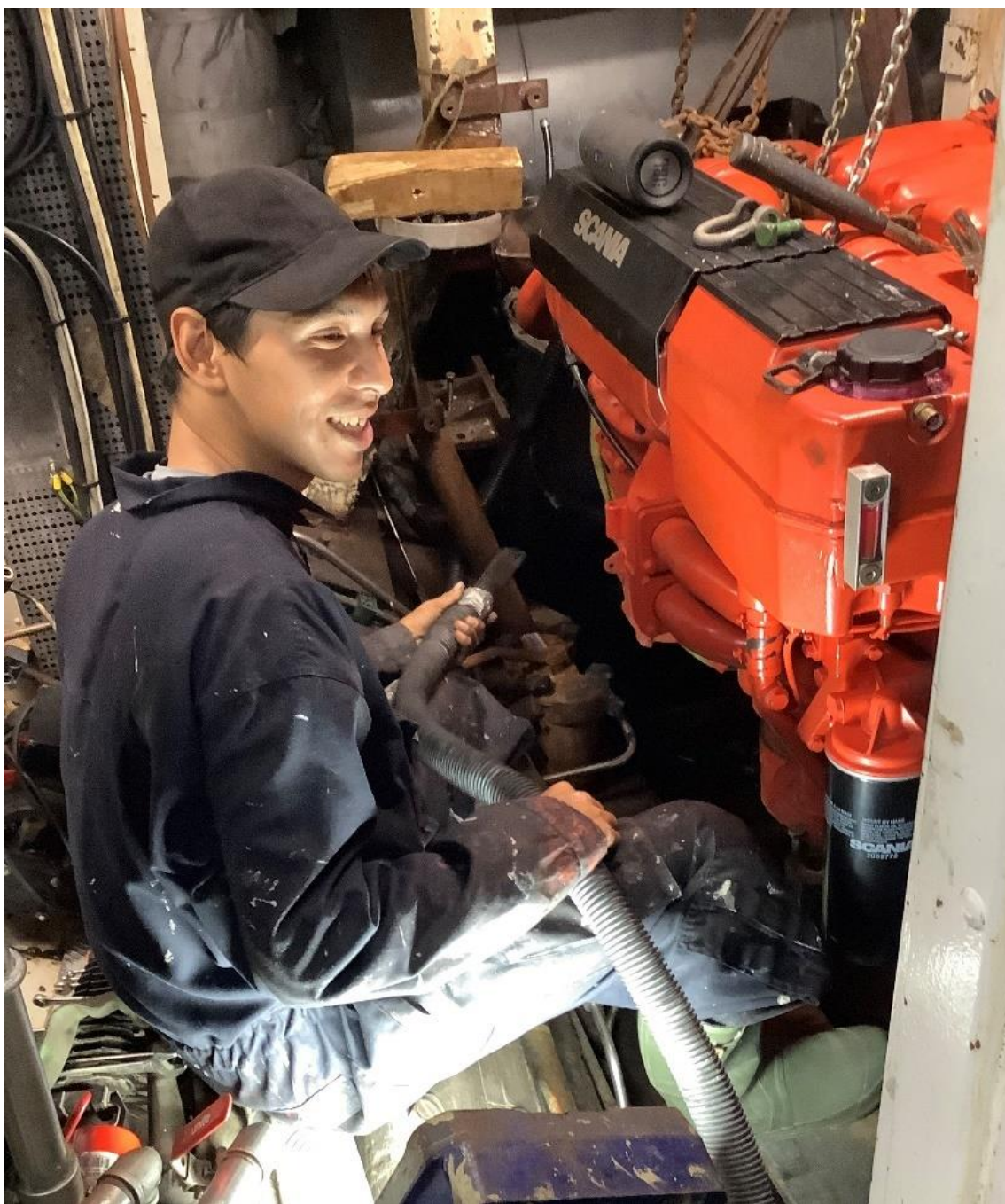
Figur 22. Esbjerg matros i maskinrummet. © Fulton