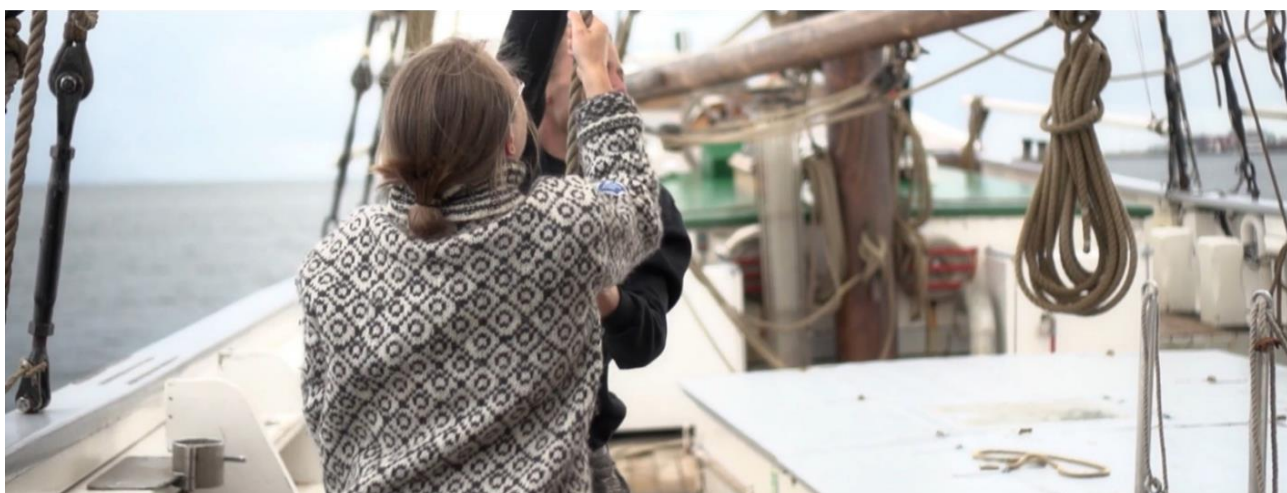
Figur 9. Der sættes sejl.

Den pædagogiske tilgang er i princippet og i praksis anerkendende, støttende og motive- rende (Lyng, 2007). De unge støttes og opfordres til at kaste sig ud i nye udfordringer og opgaver, men møder samtidig accept, hvis de ikke har modet eller lysten til at afprøve noget nyt. Det vigtigste på Fulton er som nævnt, at man prøver og gør sig umage (Jensen, 2021). Det anerkendende element kan ses og forstås som lyttende. De unge udtrykker netop i in- terviewene, at noget af det, der rykker og gør en forskel på Fulton, er at de oplever at blive taget alvorligt, at der bliver lyttet til dem, at de kan tale med personalet, primært skipper,