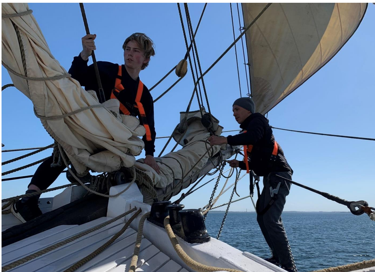
Figur 30. Forsejlene pakkes.