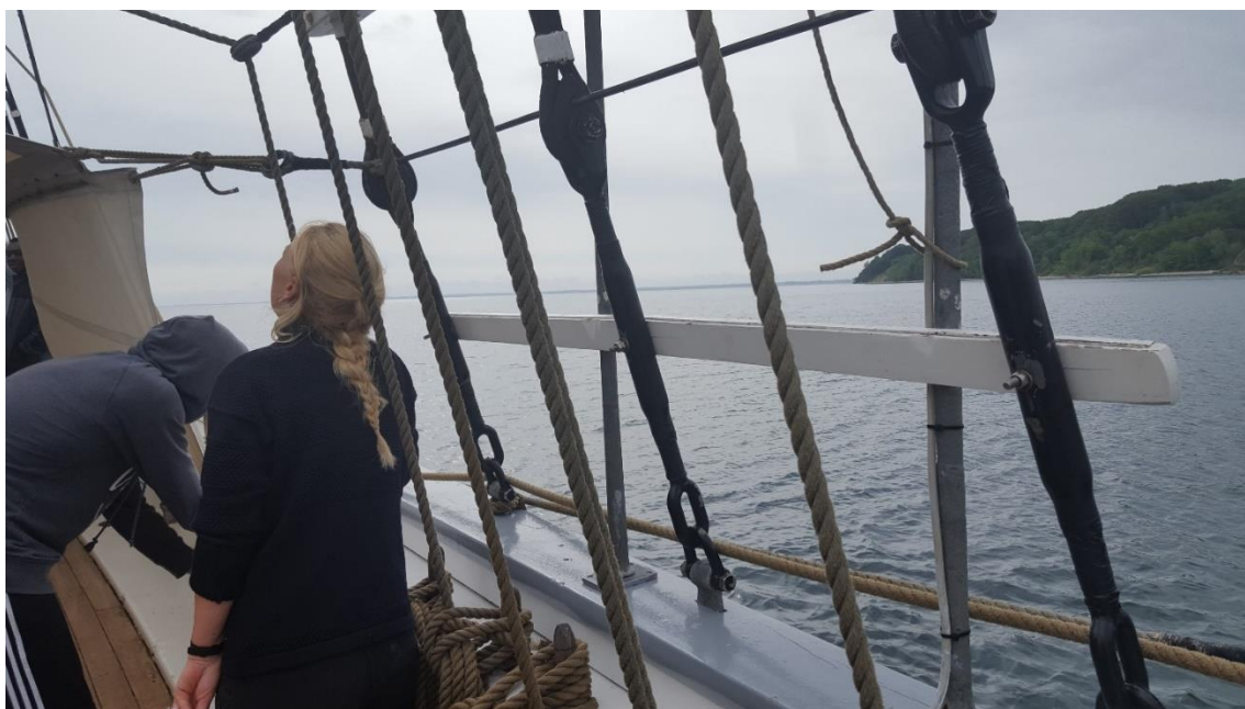
Figur 23. Udsigt fra Fulton til Røjle Klint ved Lillebælt.