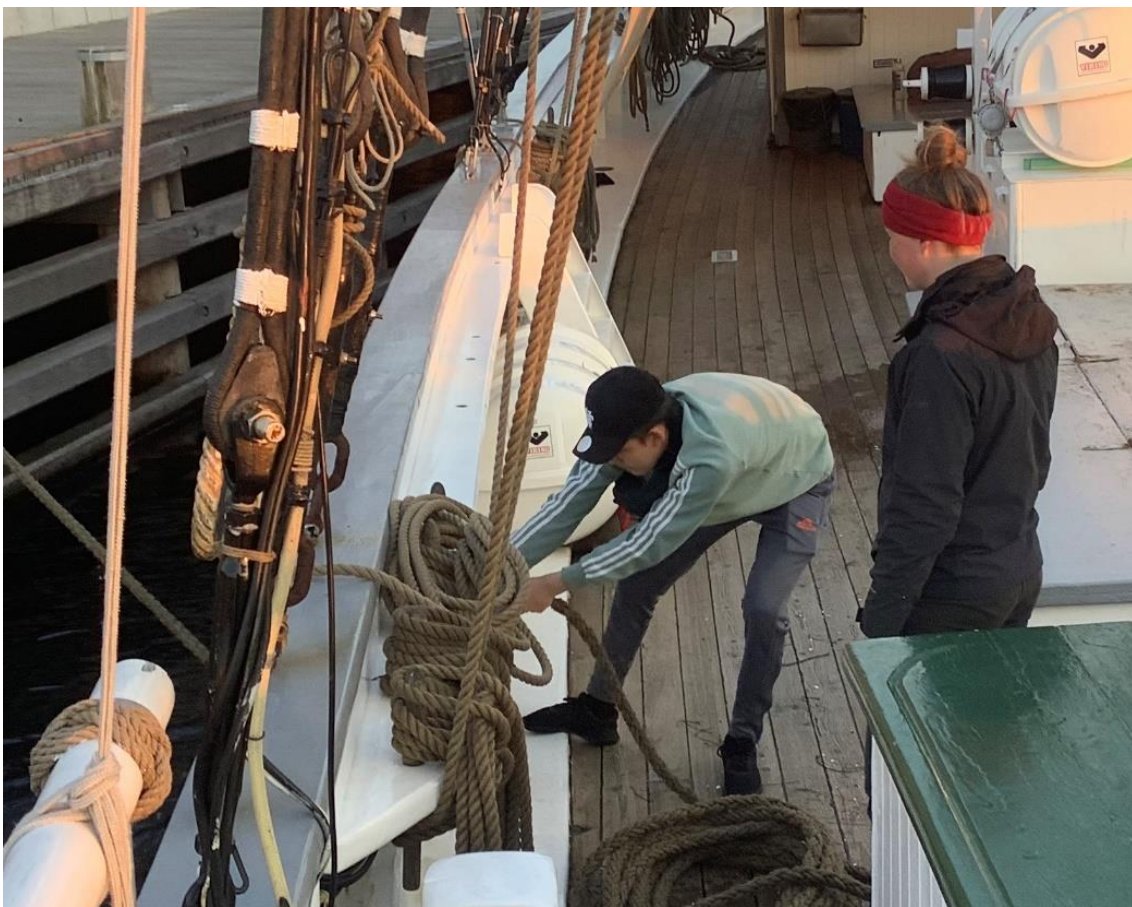
Figur 11. Styr på for tøjningerne.