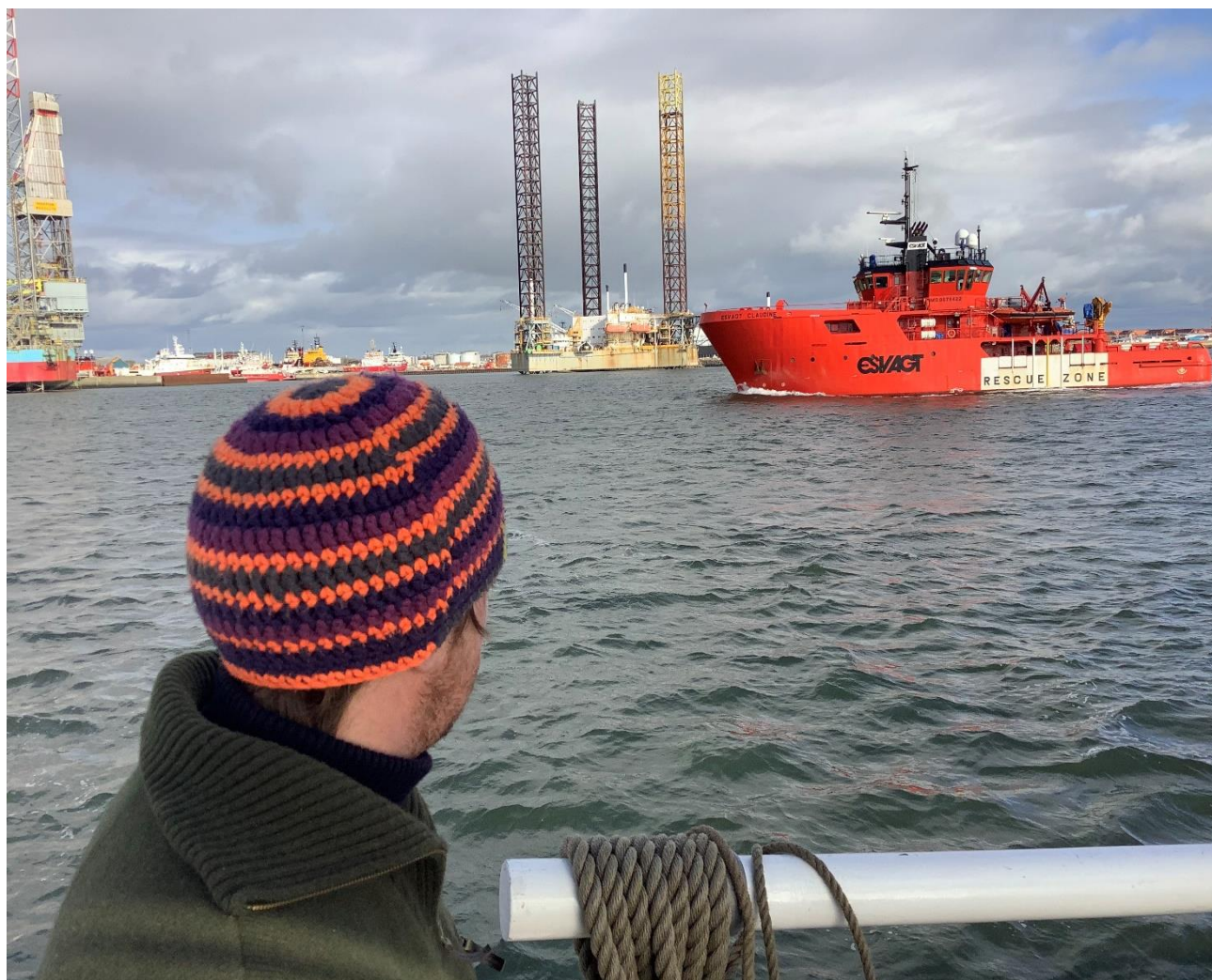
Figur 15. Udsigt til jobmulighed. Esvagt er et af de firmaer, som flere af Fultons Esbjerg matroser har fået arbejde hos