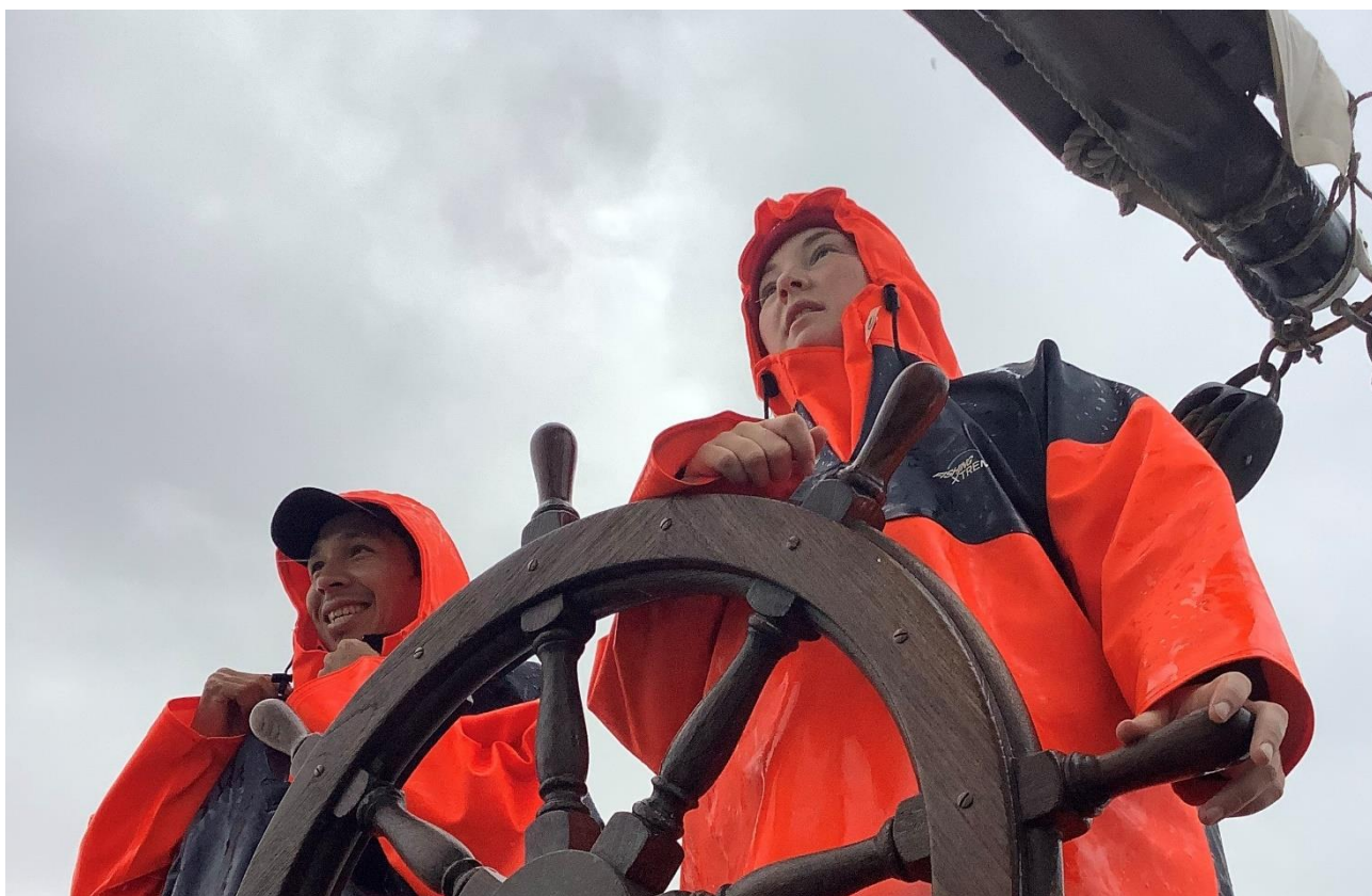
Figur 25. Sidemandsoplæring ved roret