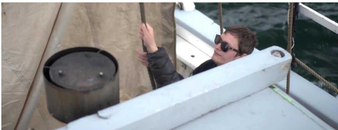
Figur 8. Sejl gøres klar