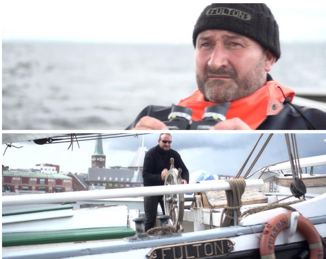
Figur 4. Skipper på Fulton