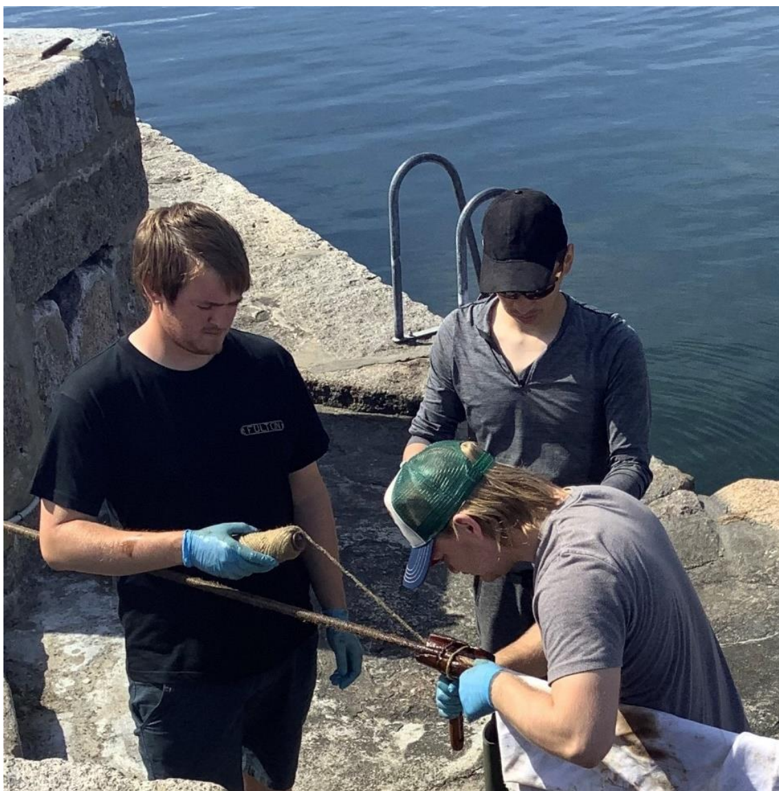
Figur 27. Sidemandsoplæring på kajen. © Fulton