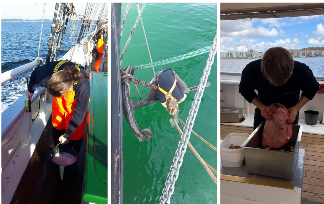
Figur 3. Esbjerg-matroser på Fulton

Lauritzen Fonden er en erhvervsdrivende fond, der yder støtte til almennyttige aktiviteter. Fonden arbejder ud fra en vision om at understøtte børn og unge til at blive bidragende medborgere i Danmark (Lauritzen Fonden, 2020). Fulton fonden er den fond, der driver Fulton projektet, bl.a. med støtte fra Lauritzen Fonden. I forbindelse med Fulton-projektet blev der indgået en partnerskabsaftale mellem de to fonde (Fulton Fonden & Lauritzen Fonden, 2017)